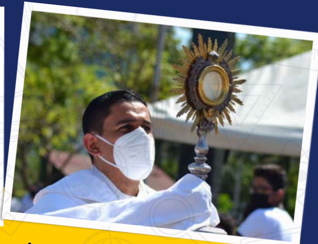
Atención Humana, Psicológica y Espiritual