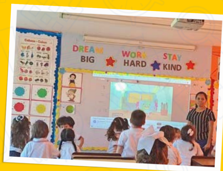
Aulas equipadas con tecnología y uso de plataformas educativas