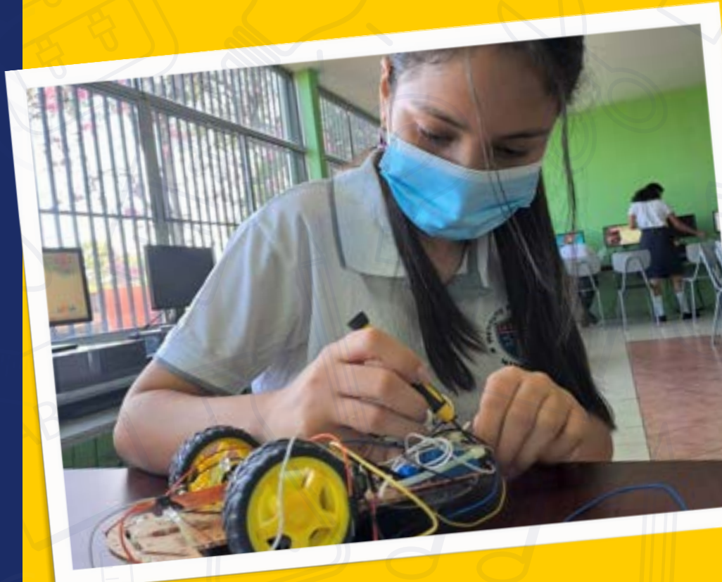
Computación y Robótica